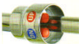
・上昇下降押ボタンスイッチ