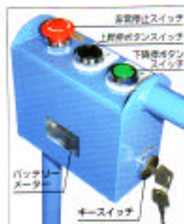
バッテリーメーター