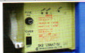
搭載型バッテリー充電器 (AC100V) コードリール付 (コード長さ約1.5m)