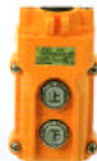
● 上昇・下降押ボタンスイッチ