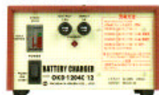
● 充電器 (搭載型)