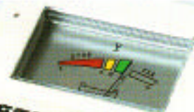
● 3色バッテリーメーター